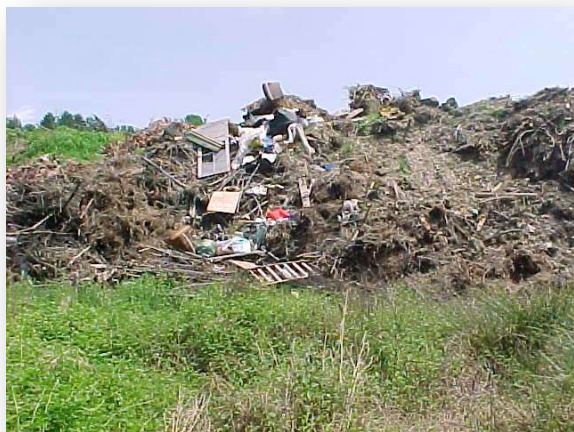
Décharge en 2002