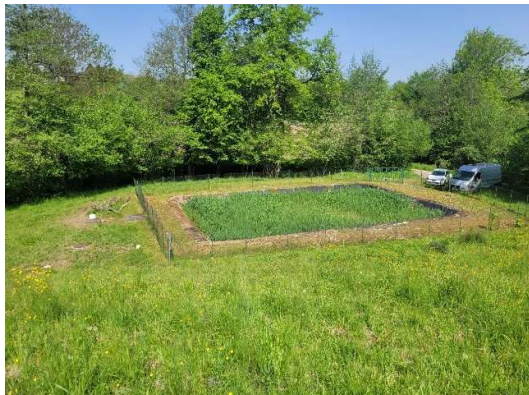
Aujourd'hui en 2025

Le site dans son état actuel, ne présente donc pas de risques environnementaux.