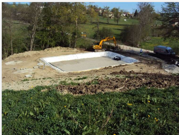
Travaux de réhabilitation en 2007