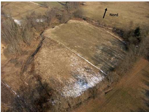
Décharge en 2006

constitue le site d'enfouissement des ordures ménagères et assimilés des communes d'Aiguebelette le lac, Ayn, Dullin, Gerbaix, Lépin le lac, Nances, Novalaise et St Alban-de Montbel.